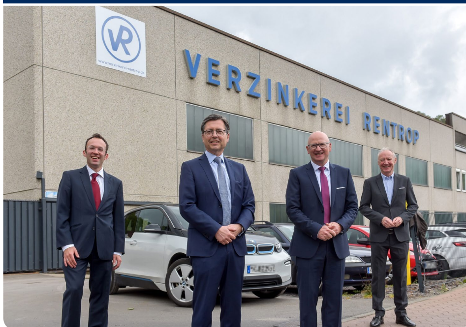
Verzinkerei Rentrop: Übertragende Sanierung im zweiten Anlauf

Im Zuge der übertragenden Sanierung gehen nicht nur die Vermögensgegenstände der Verzinkerei Rentrop, sondern auch die Immobilie und die Technischen Anlagen und Maschinen am Standort in Plettenberg, die sich im Eigentum der nicht insolventen Feuerverzinkerei-Galvanische Anstalt Otto Rentrop GmbH & Co. KG befinden, auf die Verzinkerei Godesberg über. Über die wirtschaftlichen Bedingungen wurde Stillschweigen vereinbart.